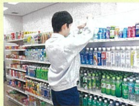
広島障害者職業能力開発校での訓練