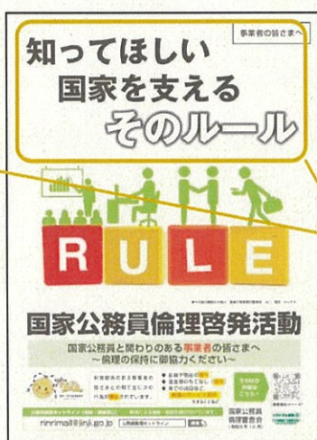
令和5年度事業者向 けポスター