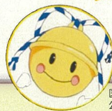
国家公務員倫理審査会 公式マスコット りんりん