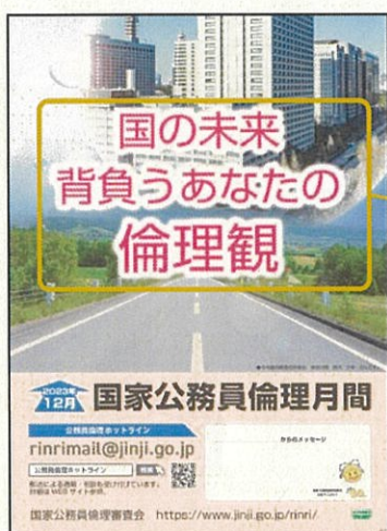
令和5年度職員向け ポスター

公務員倫理への考えや思いを、職員と事業者の方々のそれぞれの立場に沿った標語の形でお寄せください。皆様からのご応募をお待ちしています!!